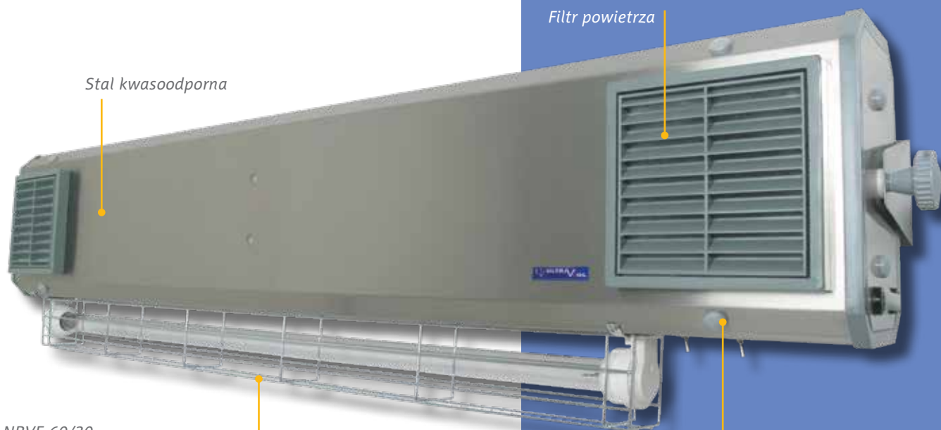
NBVE 60/30 NBVE 110/55