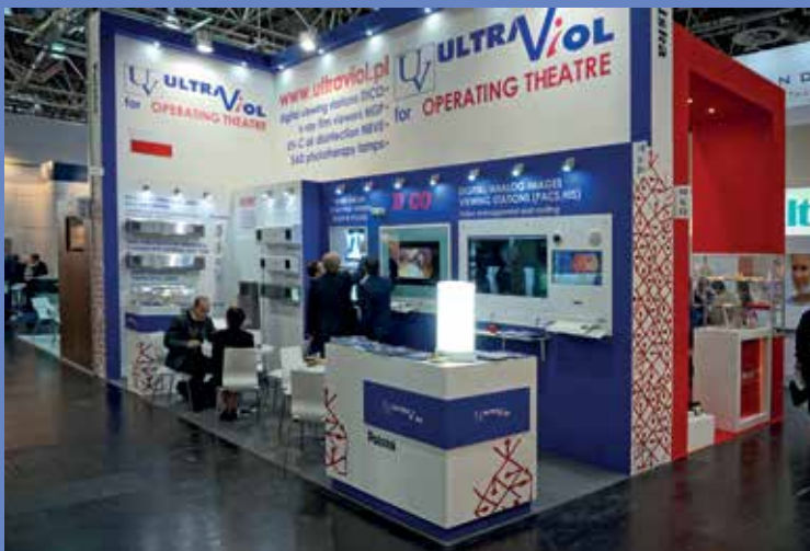
Targi Medica 2017 w Düsseldorfie