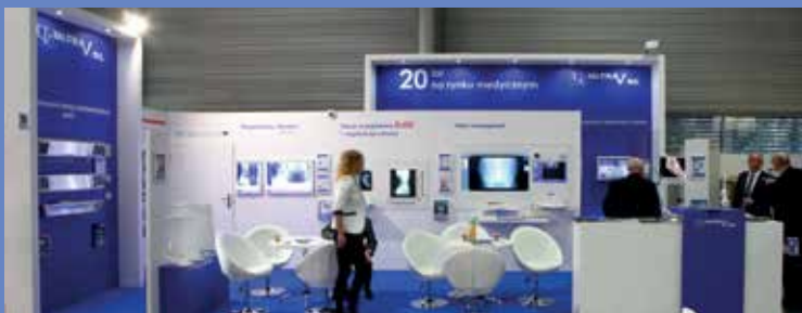
Targi Salmed 2014 w Poznaniu