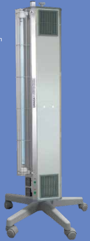
NBVE 60/30PL NBVE 110/55PL