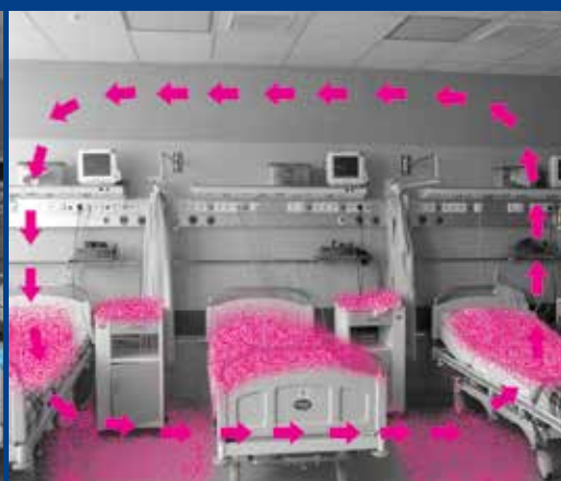
Skażone powietrze w sali bez lamp bakteriobójczych