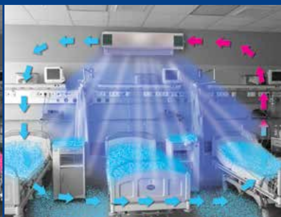
Proces oczyszczania powietrza promiennikami wewnętrznymi – funkcja I i zewnętrznymi – funkcja II (powietrze i powierzchnie)