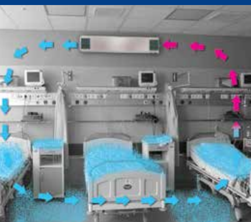
Proces oczyszczania powietrza promiennikami wewnętrznymi (powietrze)