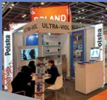
Targi Arab Health w Dubaju 2018

UltraViol jest dynamicznie rozwijającą się firmą produkującą sprzęt medyczny. Działamy od 1993 r. W ofercie mamy szeroką gamę negatoskopów, w tym ledowych, oraz lamp bakteriobójczych przepływowo i bezpośredniego działania. Jesteśmy producentem pierwszej polskiej lampy przeciwdepresyjnej Fotovita.