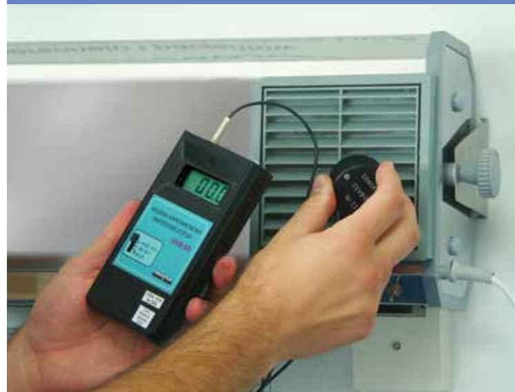
Bezpieczne dla ludzi – pomiar miernikiem napromieniowania wskazuje zero