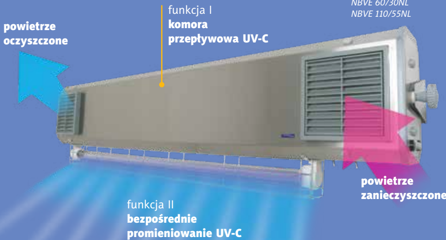
NBVE 60/30NL NBVE 110/55NL