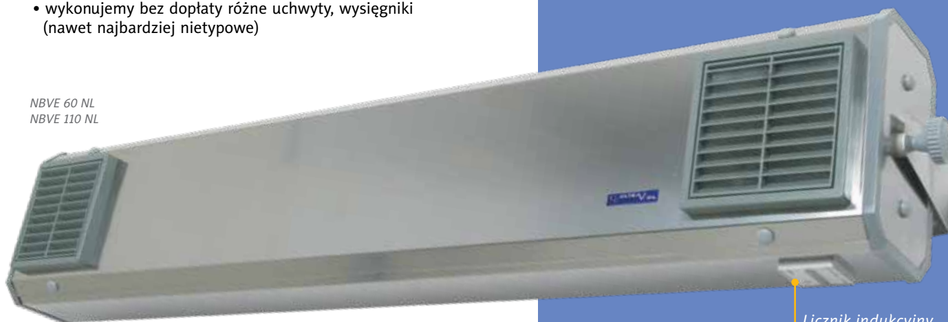
Licznik indukcyjny czasu pracy